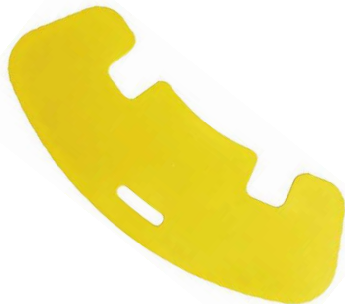
TABLA DE TRANSFERENCIA "BUFFALO 150"