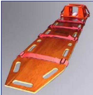
Tabla Espinal larga de Rescate