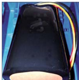
Batería de litio de larga duración que permite utilizarlo con una autonomía de hasta 12 horas.