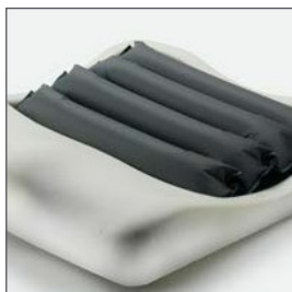
Compuesto de cuatro celdas de aire de presión alternante sobre una base.

Incorpora una funda bi-elástica que reduce la fricción. Es resistente al agua y fácil de lavar.