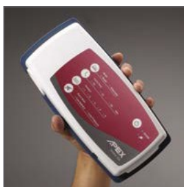
Compresor compacto, de fácil uso y silencioso.