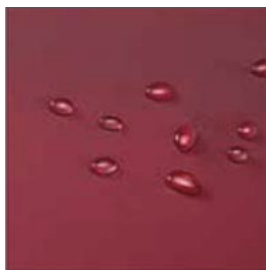
Funda PU bi-elástica, transpirable e impermeable al agua.